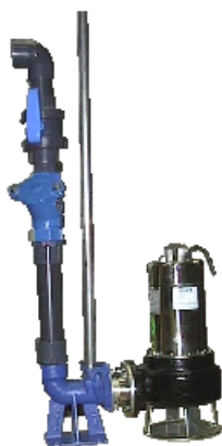
Pompe à roue vortex passage 50 mm