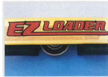
Protection des doigts en standard