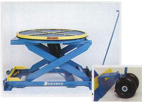
Le kit de déplacement permet de déplacer facilement l'unité à la main. En insert, détail de la roue de déplacement