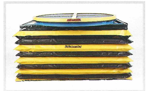
La protection à soufflets Bishamon contribue à un environnement de travail plus sûr, enfermant complètement l'unité dans une enveloppe fermée