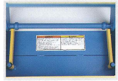
Les barres de maintenance sont utilisées pour bloquer les ciseaux ouverts lors d'une visite de maintenance