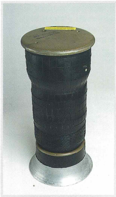
Suspension pneumatique Firestone pour lever et abaisser les palettes