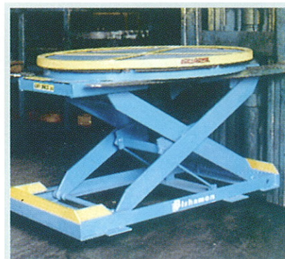
L'EZ Loader est transportable chariot élévateur.