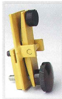
Le frein Bishamon empêche le plateau de tourner