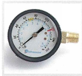
Un manomètre de grande dimension, et facile à lire