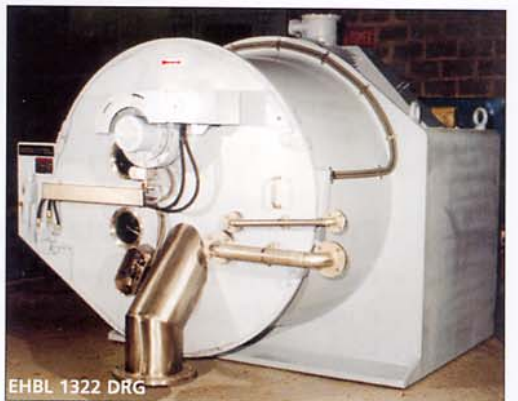
EHBL 1322 DRG