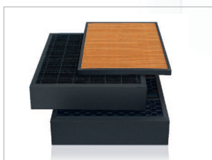
Filtre à particules fines PM2,5 + filtre HEPA + filtre au charbon actif.