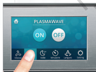
Écran de commande tactile pour une utilisation intuitive.