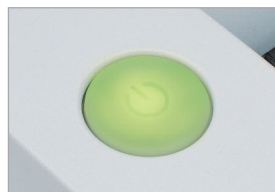
Interrupteur EASY-TOUCH avec témoin lumineux intégré