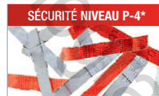
Modèle C/C - 3x25 mm Pour les documents confidentiels.