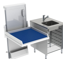
Table à langer électrique à hauteur variable 334-081-1