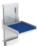
Table à langer électrique à hauteur variable 334-080-1