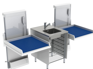
Table à langer électrique 334-082-1