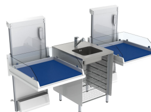
Table à langer électrique 334-083-0