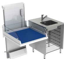
Table à langer électrique 334-082-0