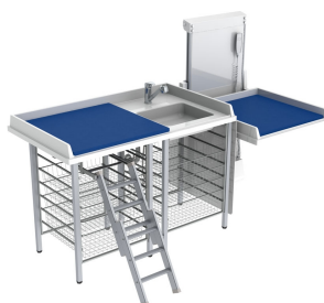
Table à langer électrique 334-083-1