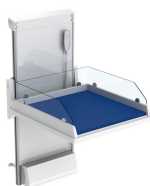
Table à langer électrique à hauteur variable 334-081-0