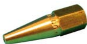
Becs de soudage