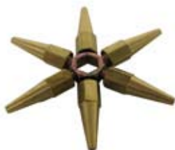
Étoile-clé 6 becs