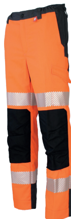
Orange Fluor/Charcoal 701730HVO