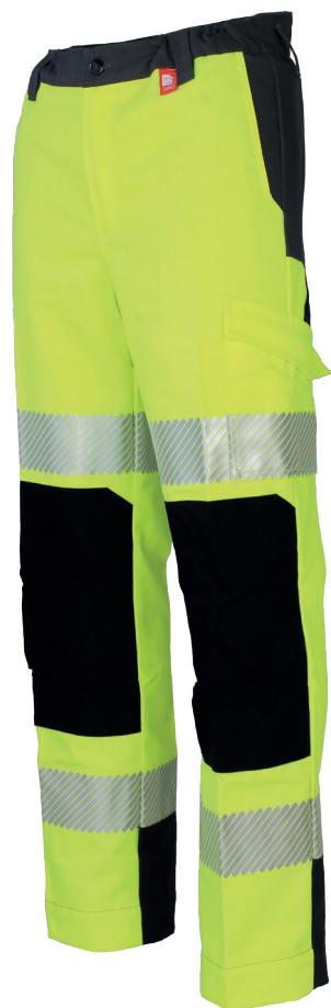
Jaune Fluor / Charcoal 701730HVJ