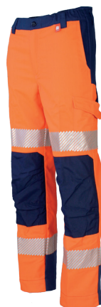
Orange Fluor/Marine 701020HVO