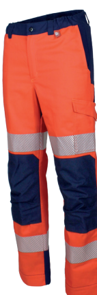
Rouge Fluor/Marine 701020HVR