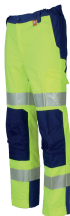
Jaune Fluor/Marine 701020HVJ