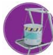
Tablette porte-outils amovible. Charge maxi : 10 kg.