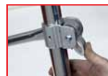
Réglage de chaque stabilisateur en un seul geste