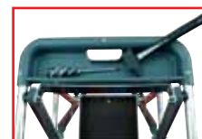
Porte-outils avec poignée de transport