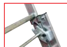
Verrouillage sûr et facile