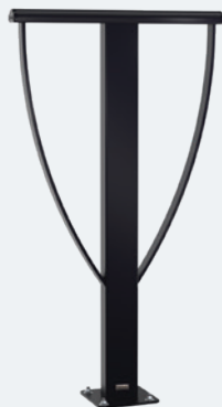
■ Réf. 297546