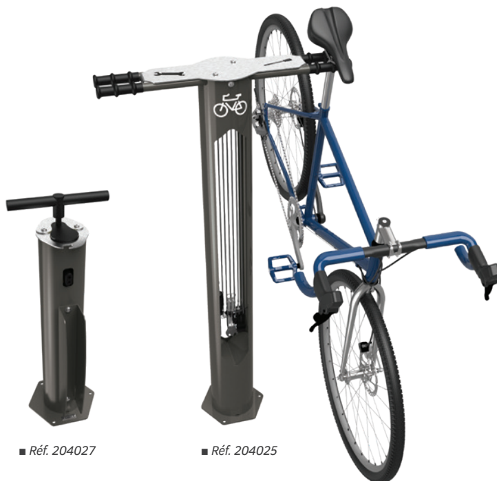
■ Réf. 204027