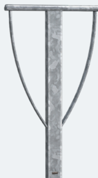
■ Réf. 207545