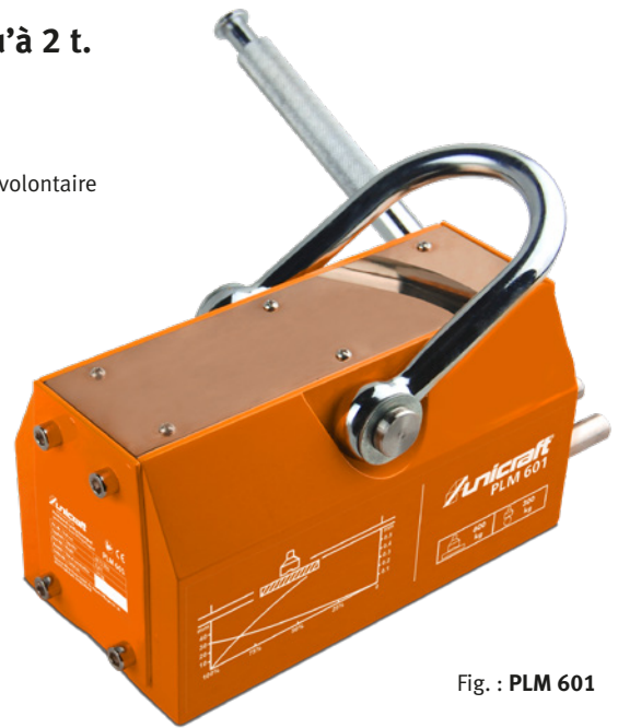
Fig. : PLM 601