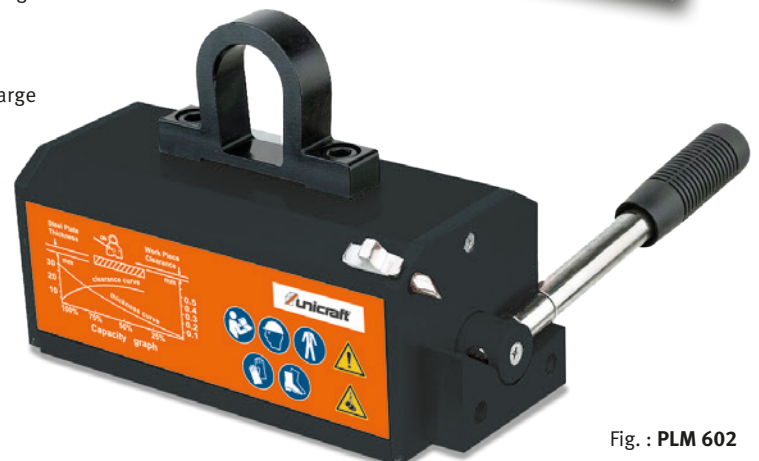
Fig. : PLM 602