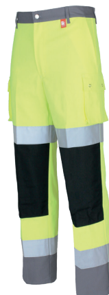
Jaune Fluo/ Gris Acier 20