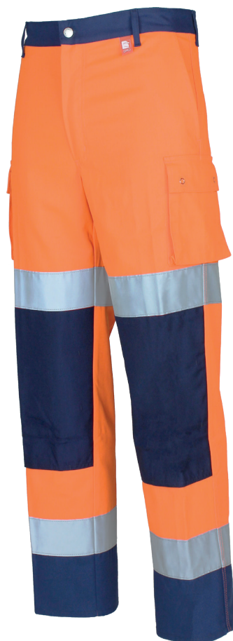
Orange Fluo/Marine 100