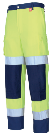
Jaune Fluo/ Marine 02