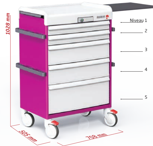
Chariot de soins Réf. : PP-M21000V3