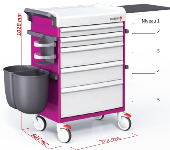
Chariot de soins équipement Réf. : PP-M21000V1

Forts de nos 20 ans d'expérience au service des Institutions médicales, nous avons analysé et défini des configurés répondant aux besoins les plus proches de vos attentes