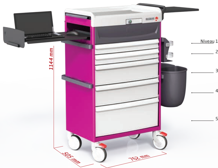
Chariot de soins caisson informatique Réf. : PP-M21000V2