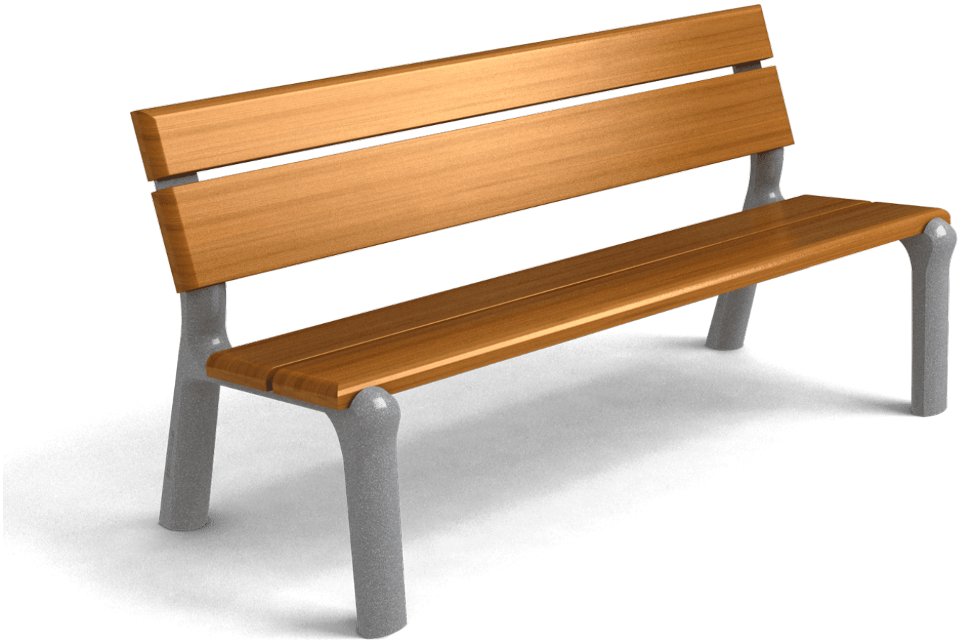
Delta XXI UM363WS