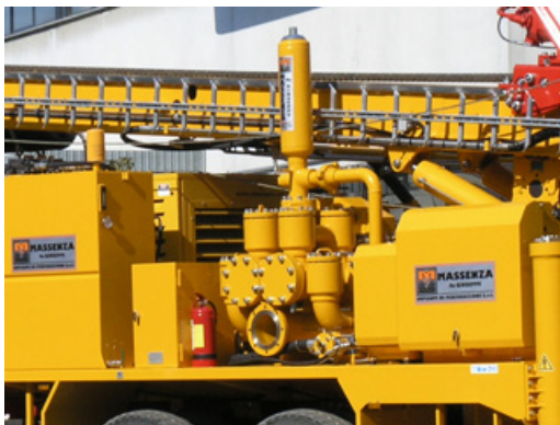
Pompa fango Mud pump Pompe à boue Spülpumpe Bomba de lodo Грязевой насос