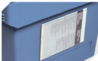
Pochettes porte-documents fixation auto-adhésive 3 côtés ouverts l 175 x l 105 mm 6-5031