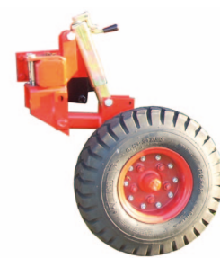
Roue de terrage