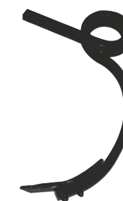
Dent carré de 30

Klappbar Grubber C30 hat dieselbe Konzeption wie C25 mit Zinken Welle 30