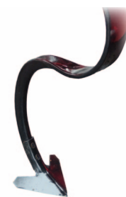
Soc patte d'oie