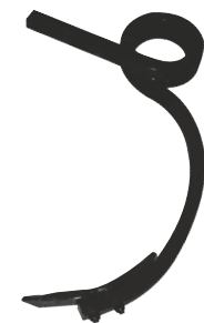
Dent carré de 25

Zweibalkige Rahmen mit spezial Stahl Welle 80 - Balkenabstand 700 mm - gefederte vierkantzinken 25 mm mit doppelschare 40x16. Verstärkte 3 Punktaufnahmen oder Schnellkupplung - Rahmenhöhe 500 mm.