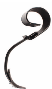
Dent grand dégagement

Räder 600x9 - Räder 6,5x10 - Vierbalkige Rahmen mit Welle 100x8 - Hintere Krümelwalze Ø450 mm oder 540 mm - Striegelelege mit 3 Reihen.