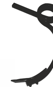
Dent double spire Ø170 carré de 35

Rohrrahmen welle 100x8 für die Klappbaren Modellen - Zinken doppelgedreht Ø170 Welle 35 - Rahmenhöhe 700 mm - Abstand zwischen Balken 800mm - Verstärkte standard Kupplung oder Schnellkupplung n°2 oder n°3.