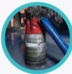
POMPE DE RELEVAGE