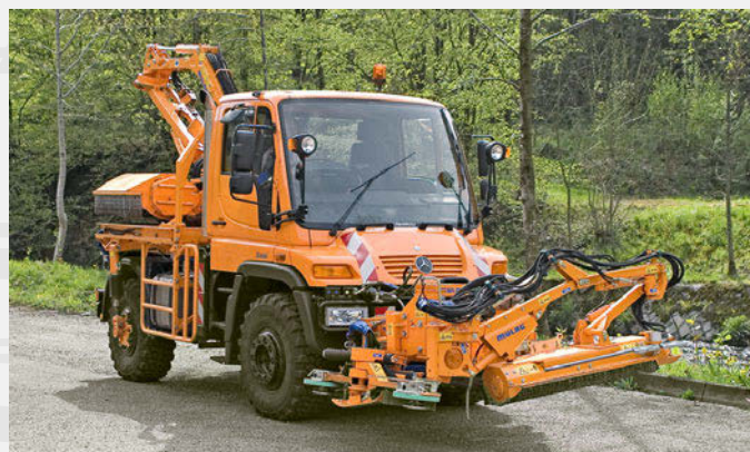
MLM 200 en position de transport