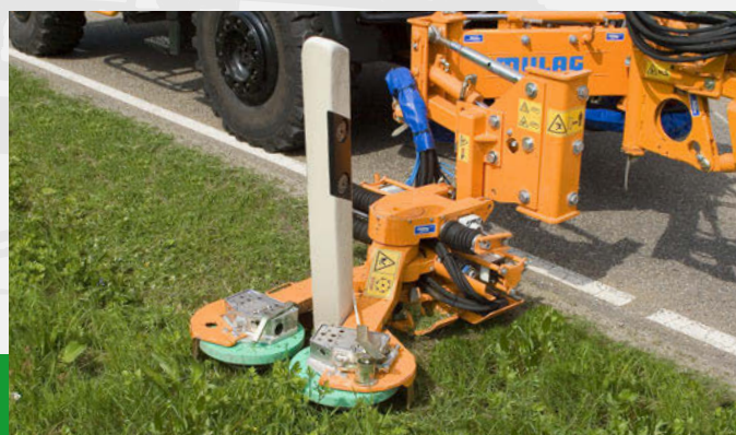
Complément idéal pour le travail avec une faucheuse d'accotement