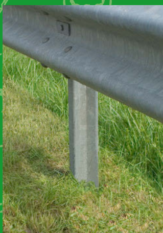
Fauchage des glissières de sécurité