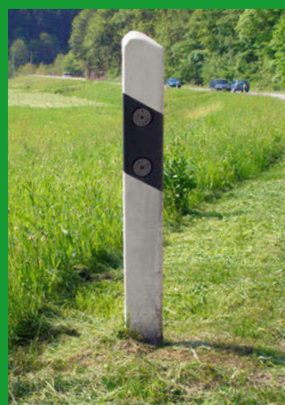
Fauchage des délinéateurs