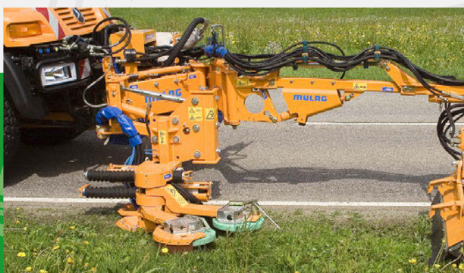
Technique professionnelle dans la qualité MULAG