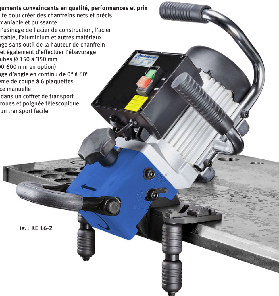
Fig. : KE 16-2