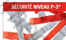
Modèle C/C - 4x60 mm Pour les documents confidentiels.