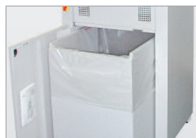
Évacuation aisée du sac plein