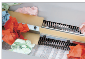
Accepte sans problème les papiers froissés