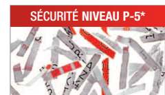
Modèle C/C - 2x15 mm Pour les documents confidentiels ou secrets.