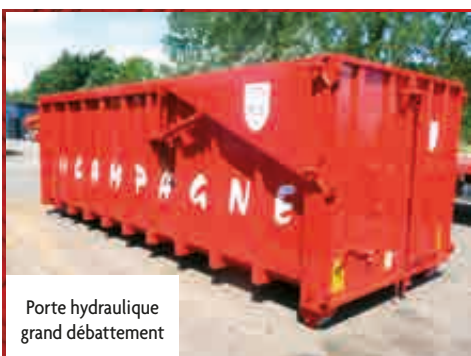
Porte hydraulique grand débattement