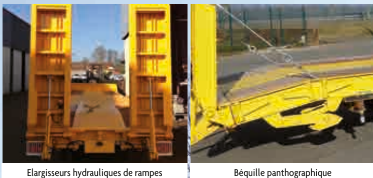
Elargisseurs hydrauliques de rampes