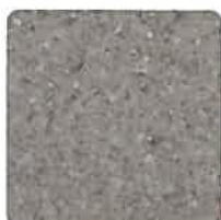
Stone - Surestep - Similaire à la pierre

Choisissez parmi nos couleurs standards, sélectionnées ou premium pour personnaliser votre élévateur. Utilisez des couleurs et des matières pour intégrer votre appareil à votre décoration ou pour créer un effet de contraste. Gaine, sol, plateforme, portes : l'intégralité de votre appareil peut être personnalisée.