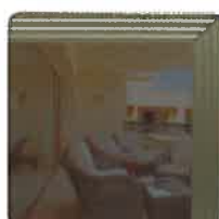
Gris fumé foncé