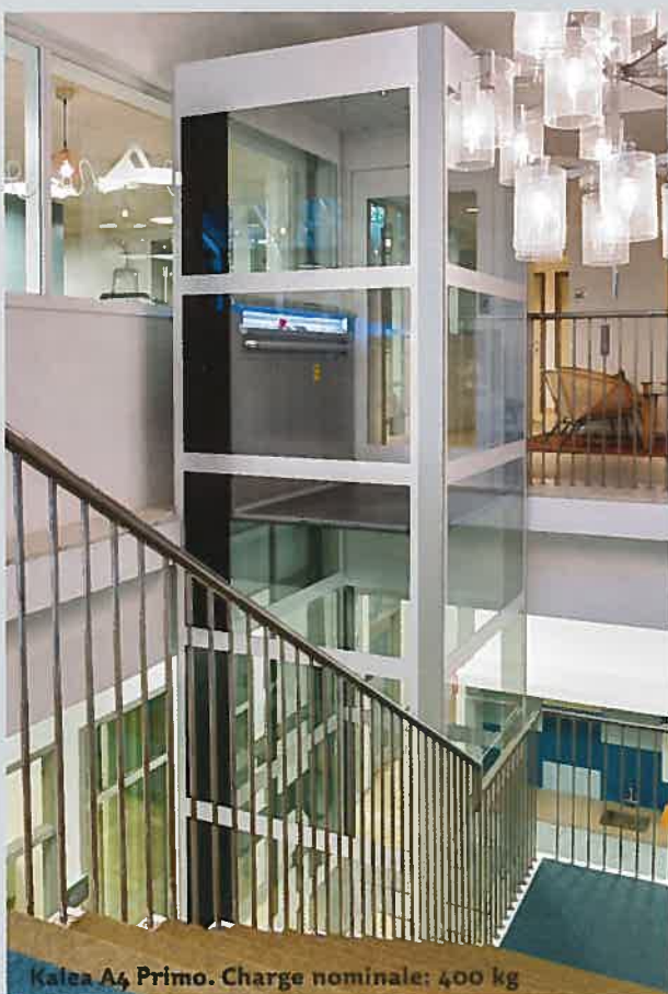
Kalea A4 Primo. Charge nominale: 400 kg

Placé juste à côté de l'escalator, cet A4 Primo préserve l'espace de vente tout en permettant l'accessibilité des PMR* à cette boutique de grand centre commercial. Cet élévateur est équipé d'une paroi haute élégante composée d'un miroir et d'un éclairage LED.