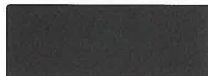
RAL 7012 GRIS BASALTE, SELECTION