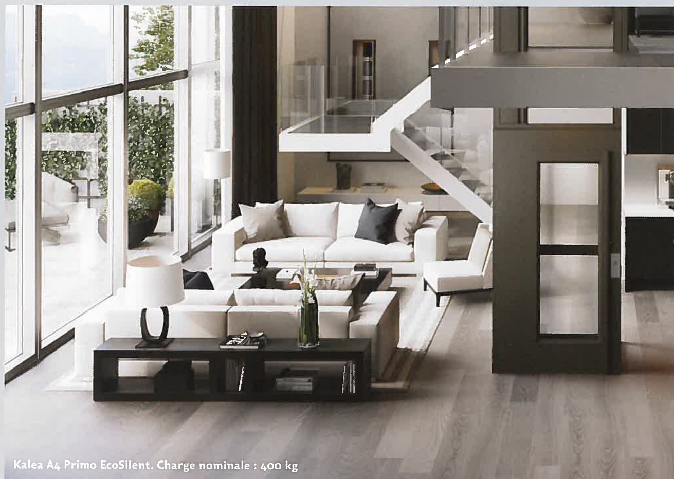
Kalea A4 Primo EcoSilent. Charge nominale : 400 kg