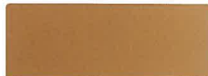
ANODIC GOLD, PREMIUM