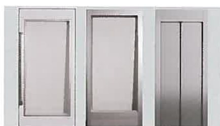
Choix de portes En acier, aluminium ou coupe-feu