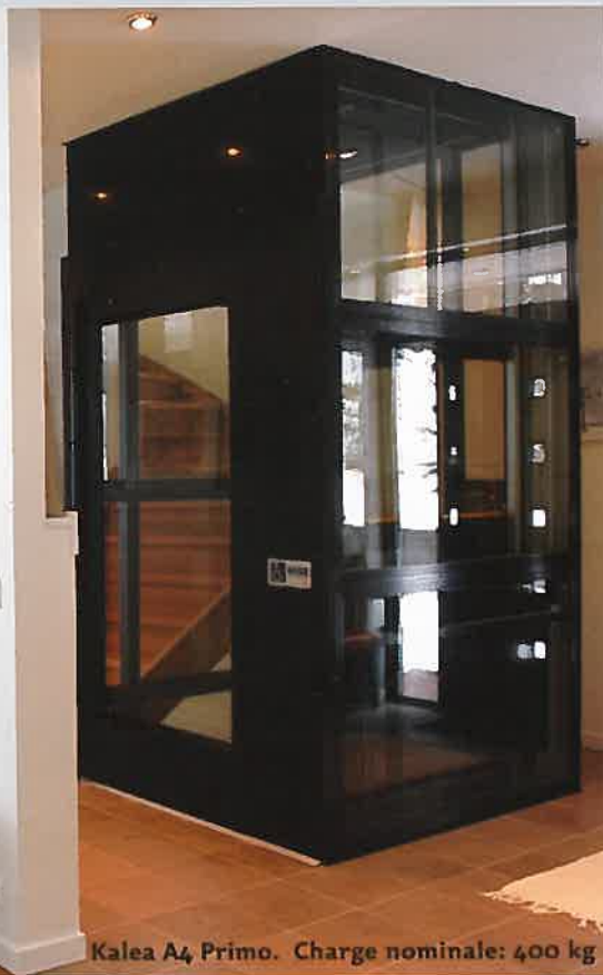
Kalea A4 Primo. Charge nominale: 400 kg