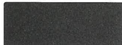
RAL 7021 GRIS NOIR, SELECTION