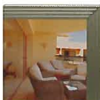
Bronze fumé léger