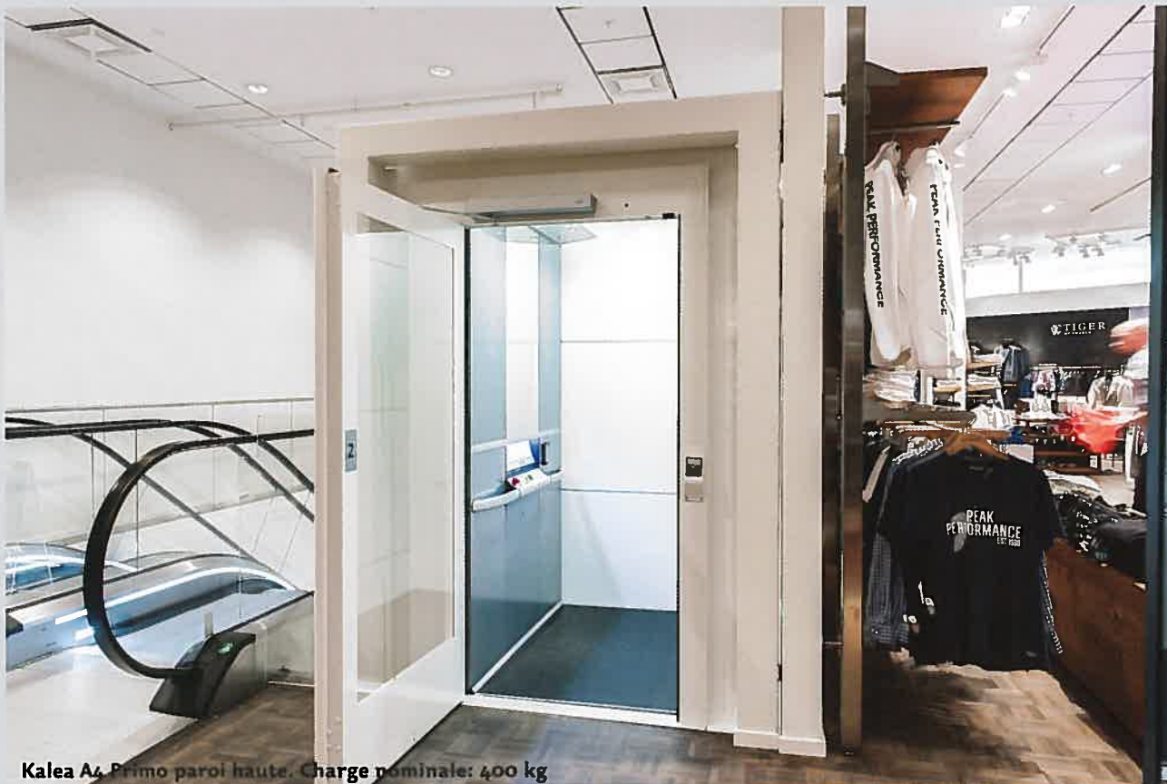
Kalea A4 Primo paroi haute. Charge nominale: 400 kg