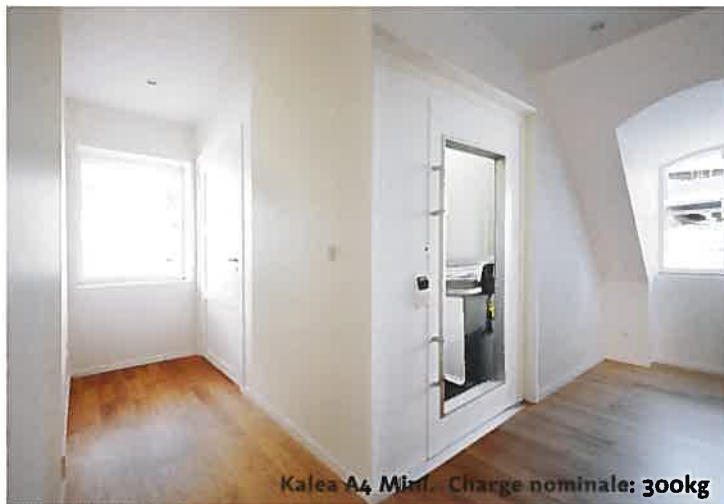
Kalea A4 Mini. Charge nominale: 300kg