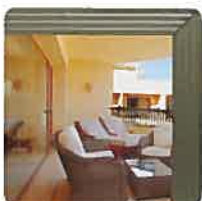
Transparent - Std