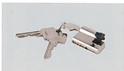
Systèmes de verrouillage Limitez l'accès à votre élévateur