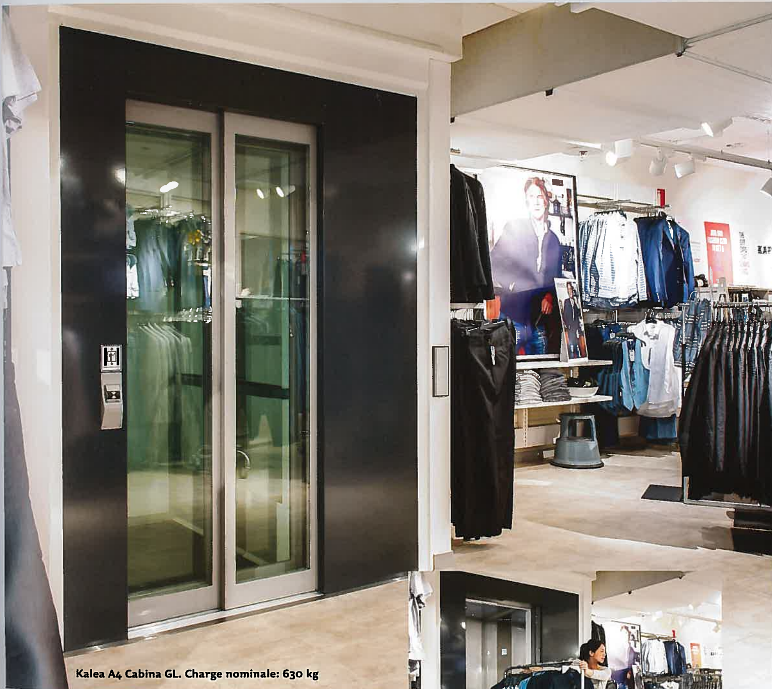
Kalea A4 Cabina GL. Charge nominale: 630 kg

Le A4 Cabina GL est livré avec sa propre gaine vitrée ou tôle. Pour cette boutique, le peu de contraintes techniques, le design et la fonctionnalité du A4 Cabina GL ont déterminé le choix de cet élévateur.