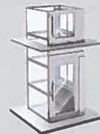
1. Service simple