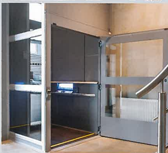
Kalea A4 Mille. Charge nominale : 1000 kg

Cet immeuble de bureaux avait besoin d'un élévateur de grande capacité pour permettre à la fois le transport des usagers et de marchandises.