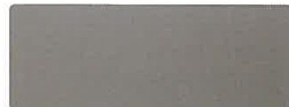
RAL 9006 ALUMINIUM BLANC* (STD)