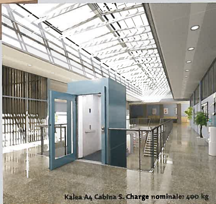
Kalea A4 Cabina S. Charge nominale: 400 kg

Le Kalea Cabina S est installé avec sa propre gaine en acier. Idéal lorsque le choix d'une solution de mobilité verticale à cabine s'impose et que les pré-requis techniques d'un ascenseur traditionnel sont trop lourds voire impossibles.