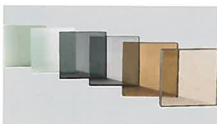
Vitrages teintés Ajoutez de la couleur avec du vitrage teinté