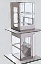
2. Service en équerre