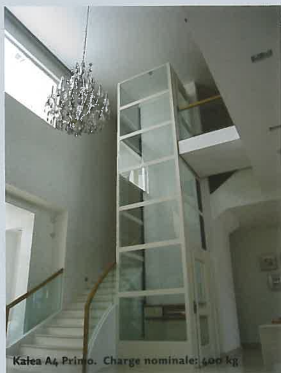
Kalea A4 Primo. Charge nominale: 400 kg