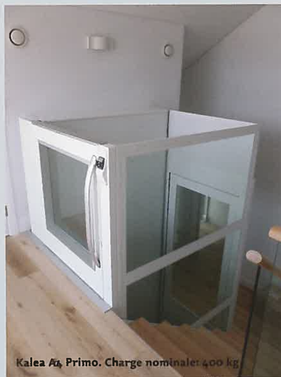
Kalea A4 Primo. Charge nominale: 400 kg

En parfaite harmonie Les élévateurs électriques à vis sans fin Kalea A4 s'intègrent très facilement sans gros travaux de maçonnerie et sans les contraintes techniques des ascenseurs traditionnels. Les nombreuses finitions et tailles vous permettent de créer votre appareil en fonction de vos attentes fonctionnelles et architecturales.