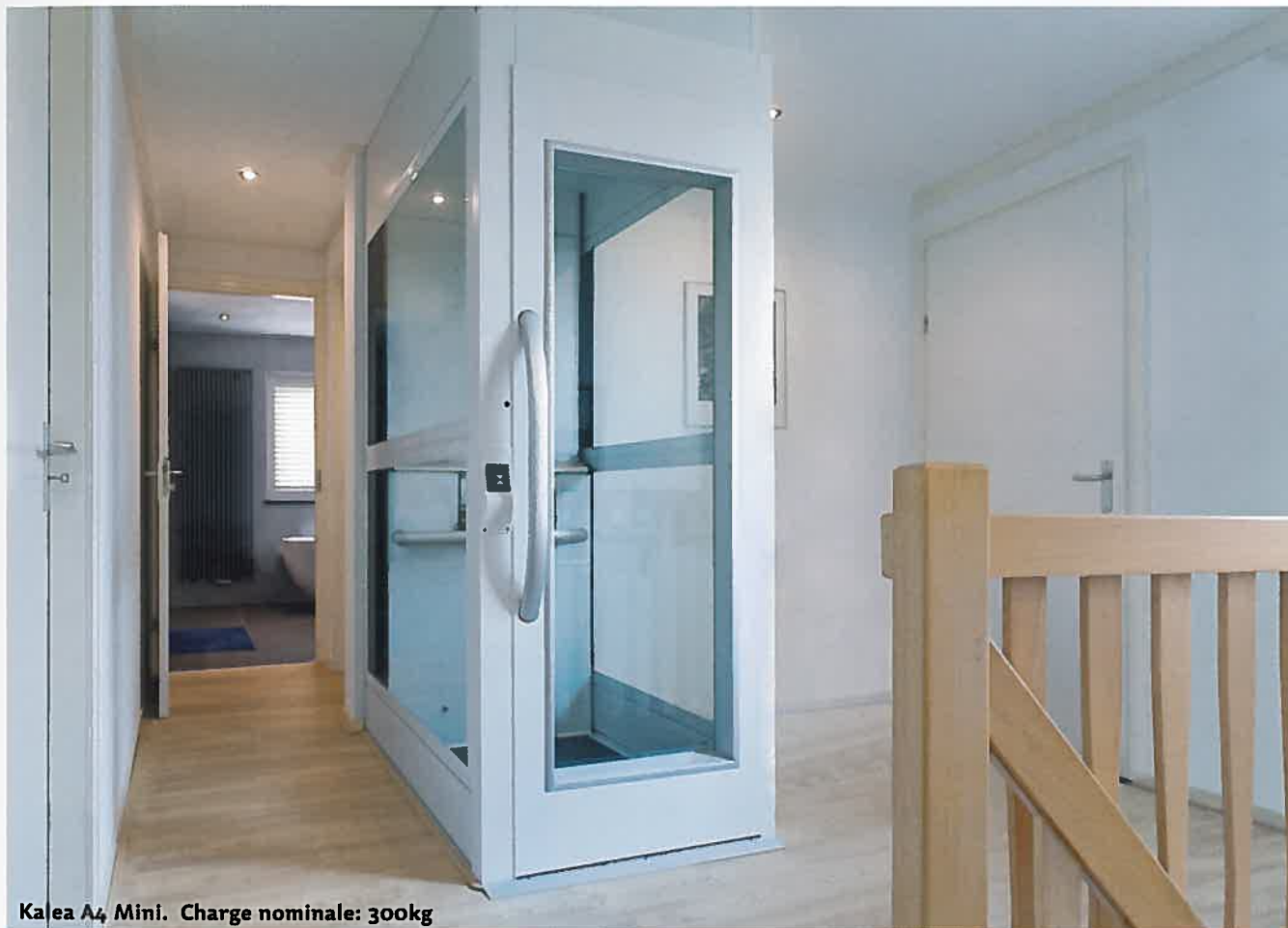
Kalea A4 Mini. Charge nominale: 300kg

Le confort chez soi Le Kalea A4 Mini est assez compact pour s'intégrer dans les plus petits endroits tels que les cages d'escaliers et suffisamment spacieux pour révolutionner votre quotidien. Imaginez votre logement sans marches, une maison où tous les étages seraient accessibles d'une seule pression de bouton. Le A4 Mini peut réaliser ce rêve.