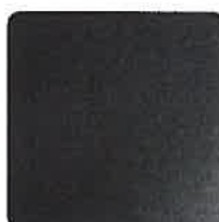
Sol standard noir