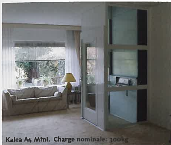
Kalea A4 Mini. Charge nominale: 300kg