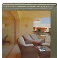
Gris fumé léger