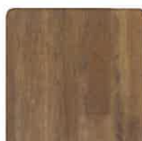
Wood - Surestep - Similaire au bois