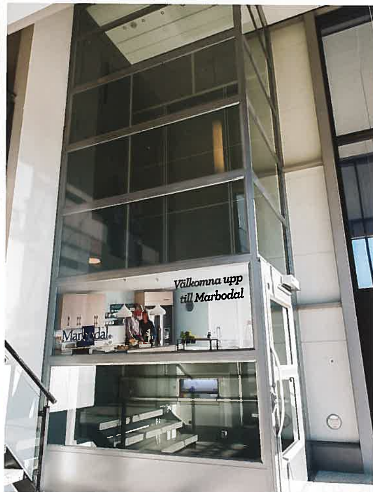
Kalea A4 Mille. Charge nominale : 1000 kg

Puissant & polyvalent Le Kalea Kalea A4 Mille est incroyablement spacieux et puissant. C'est l'élévateur idéal pour transporter des marchandises lourdes, des groupes de 8 à 10 personnes, des brancards ou des lits d'hôpitaux.