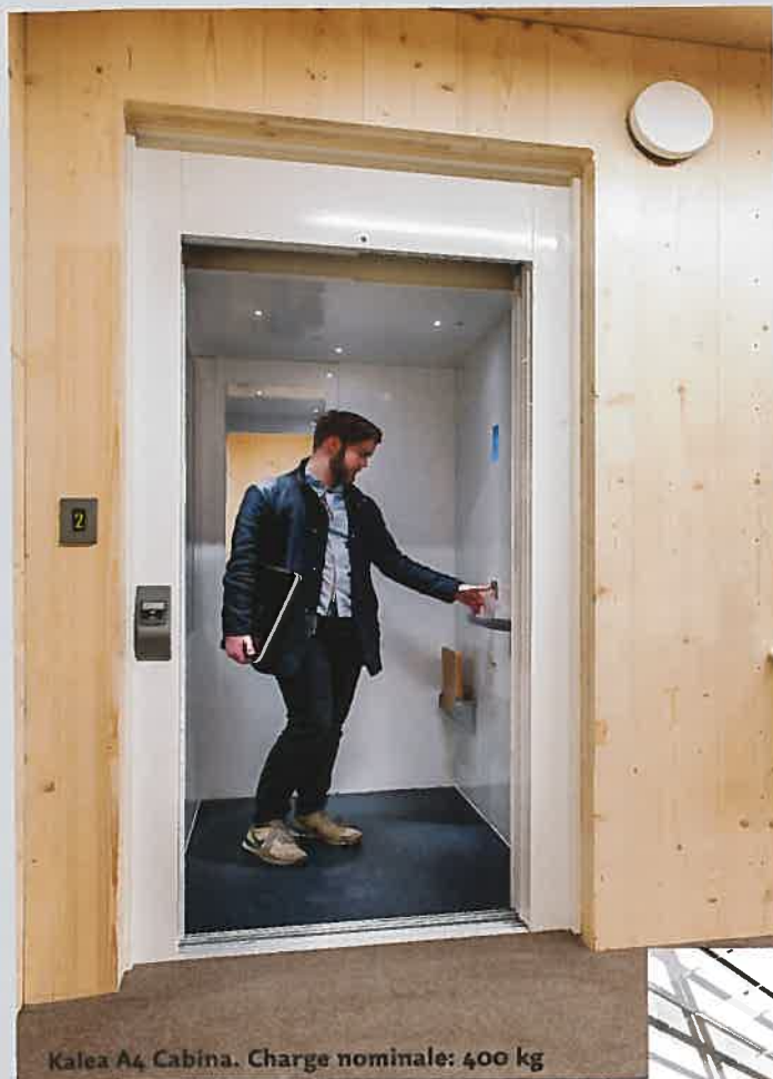
Kalea A4 Cabina. Charge nominale: 400 kg

Le Kalea Cabina s'installe dans une gaine maçonnée existante. Avec sa cabine fermée, ses portes télescopiques et ses commandes automatiques, il ressemble trait pour trait à un ascenseur traditionnel, pourtant la différence est bien réelle.