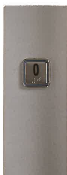
Boutons d'appel Boutons de forme carré ou circulaire