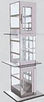
3. Service opposé