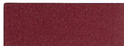
RAL 3013 ROUGE TOMATE, SELECTION