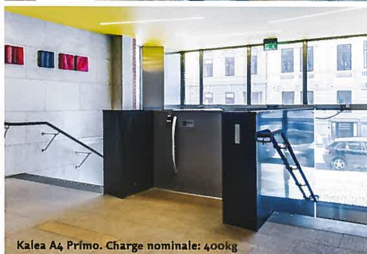
Kalea A4 Primo. Charge nominale: 400kg