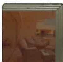
Bronze fumé foncé