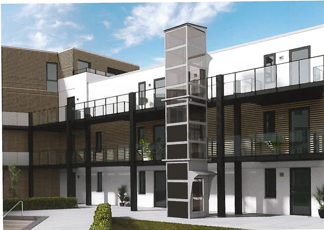
Kalea A4 Primo Extérieur. Charge nominale : 400 kg