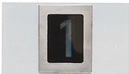
Indicateurs d'étage Ecran 4" et annonce vocale