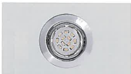
Eclairage LED Eclairage à large portée réglable