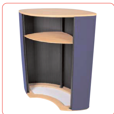
Etagère fournie (comptoir ouvert sur l'arrière)