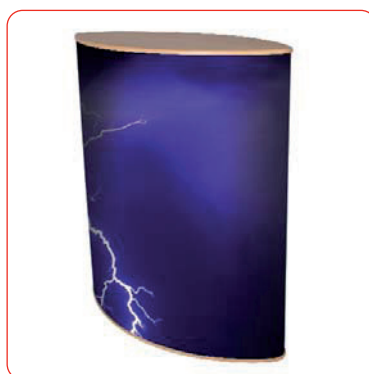
Les visuels laminés peuvent être appliqués sur la façade du tambour ou imprimés directement.