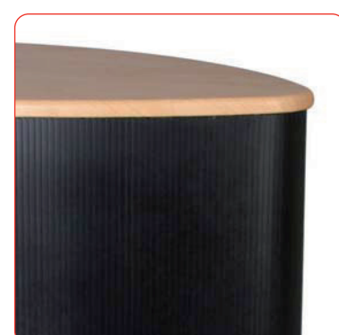
La façade du tambour en plastique est disponible en noir, blanc ou recouverte de tissu Prelude.