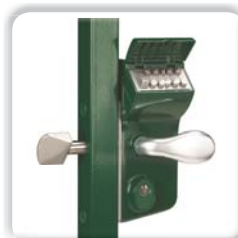
SERRURE À CODE MÉCANIQUE