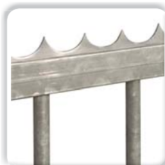
LISSE DÉFENSIVE à souder ou à visser