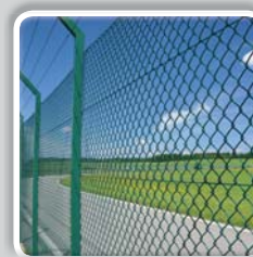
GRILLAGE SIMPLE TORSION