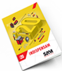
Les outils Indispensables SAM 2020

Découvrez tous nos produits dans nos catalogues en ligne