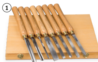
Fig. : Jeu de 8 outils à bois