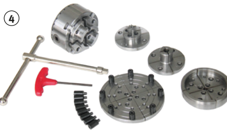
Fig. : Set Premium 4 mors