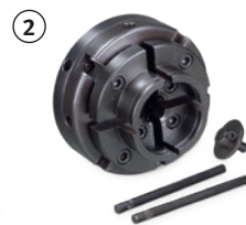
Fig. : Mandrin 4 mors