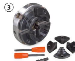
Fig. : Kit mandrin 4 mors