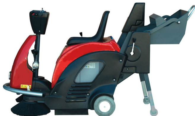
Dispositif d'aide à la décharge en inclus sur modèles PLUS