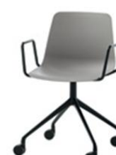
Fauteuil pyramide giratoire, alu injecté, sur roulettes