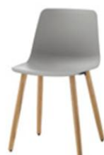
Chaise 4 pieds chêne, non empilable