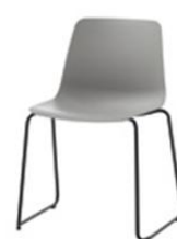
Chaise traineau, empilable