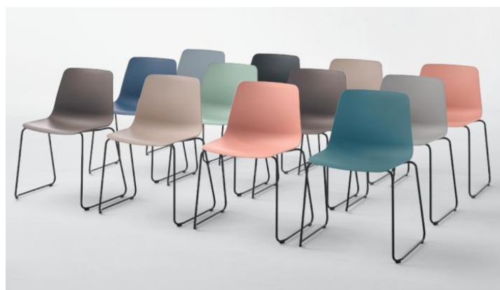
Les chaises avec piètement traineau, en tige d'acier, sont empilables, peuvent être accrochables, et sont facilement transportées avec un chariot. Elles peuvent intégrer une tablette écriteure pliante idéale pour les salles de classe et de conférence.