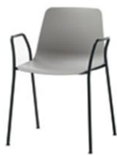
Fauteuil 4 pieds, empilable