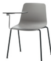
Tablette écrioite rabattable pour chaises 4 pieds ou pied traineau