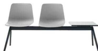
Poutre, 2 à 5 places Piètement alu injecté