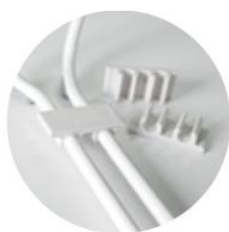
Clips de liaison pour chaises traineau