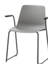
Fauteuil traineau, empilable