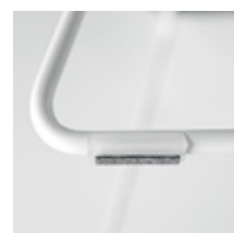
Patins de feutre pour les surfaces délicates (parquet)