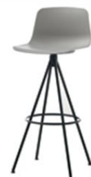
Tabouret pyramide giratoire, haut ou moyen