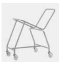
Chariot de transport