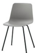
Chaise 4 pieds, non empilable