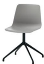
Chaise pyramide giratoire, alu injecté