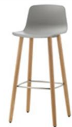
Tabouret 4 pieds chêne, haut ou moyen