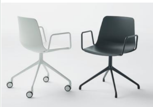
Les piètements giratoires en aluminium avec ou sans roulettes sont idéaux pour les zones de travail et de réunion.