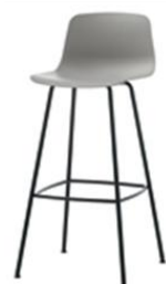
Tabouret 4 pieds haut ou moyen