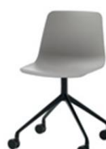
Chaise pyramide giratoire, alu injecté, sur roulettes