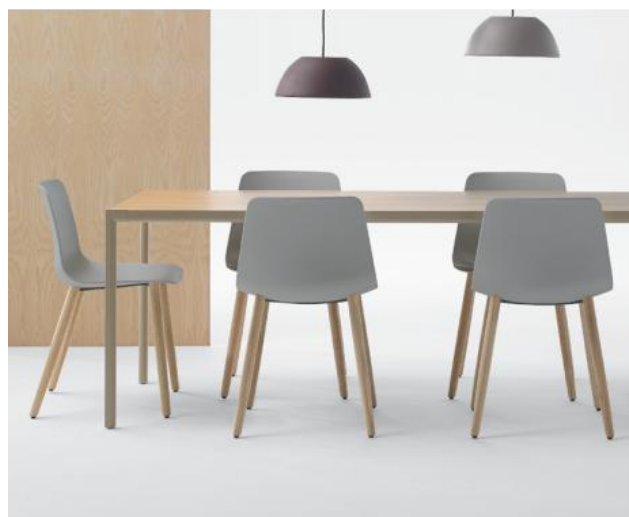
Les chaises VARYA sont également disponibles avec piètement en chêne. L'utilisation du bois naturel apporte chaleur et élégance.