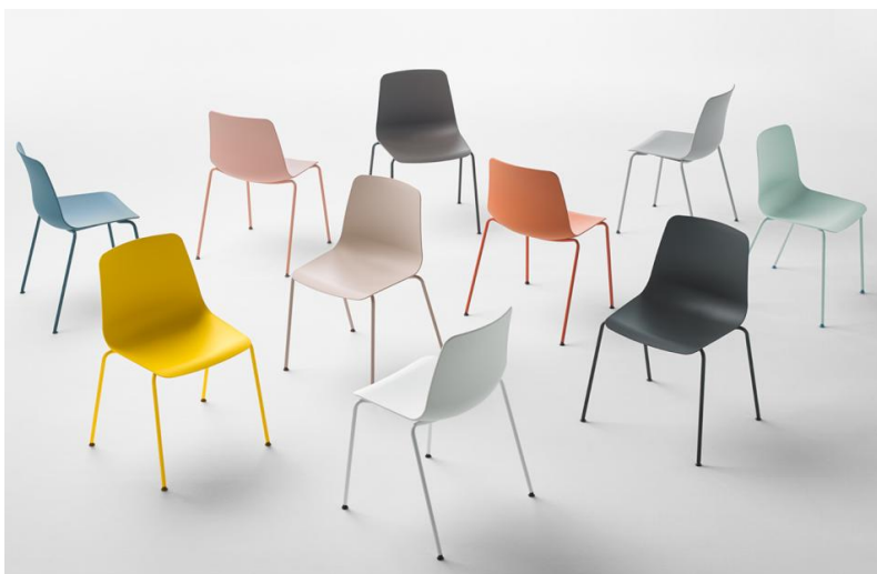
Les structures métalliques sont disponibles dans une large gamme de couleurs, pour pouvoir les assortir avec la coque.

La collection est créée en combinant des assises confortables avec différents piètements en métal ou en bois.