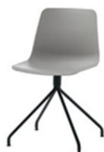
Chaise pyramide giratoire en acier