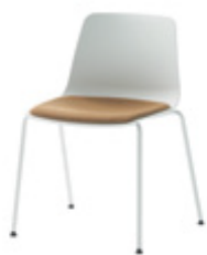
Placet d'assise fixe rembourré