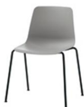
Chaise 4 pieds, empilable