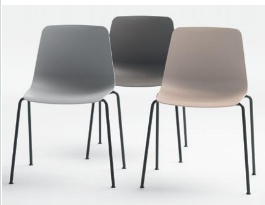
Avec un design essentiel, contemporain et intemporel, les chaises VARYA sont fonctionnelles, ont un entretien minimal et sont facilement recyclables.