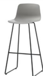
Tabouret traineau, haut ou moyen