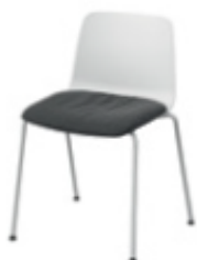
Coussin de siège amovible