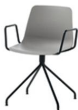
Fauteuil pyramide giratoire en acier