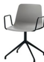
Fauteuil pyramide giratoire, alu injecté