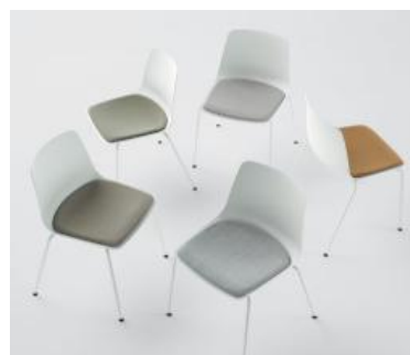
En option, l'assise tapissée offre un plus grand confort.