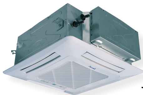
CAF 600 x 600