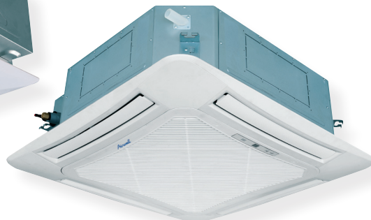
CAF 950 x 950