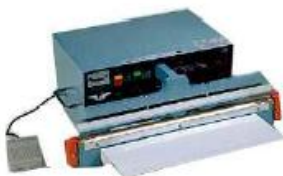
Soudeuses à impulsion automatique