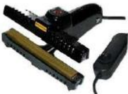
Pinces à souder

Aperçu d'autres soudeuses disponibles (consultez nous pour plus d'informations)