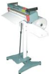
Soudeuses sur pied