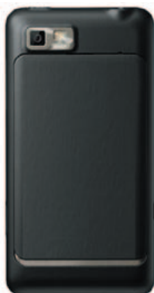
Vue de dos avec appareil photo numérique 5MPixels

Téléphone avec écran tactile 3,5" en verre, ultra résistant aux chocs, à l'eau et la poussière (IP67)