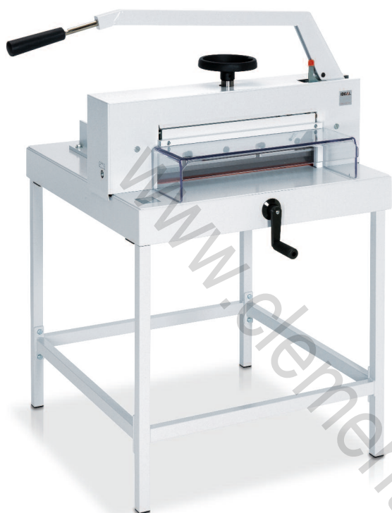
Version sur stand métallique

Massicot manuel de haut rendement pour la coupe des grands formats jusqu'à 475 mm.