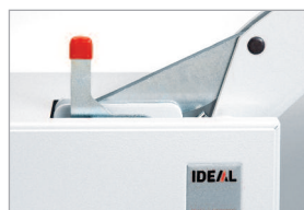
Dispositif de blocage de lame (levier en position haute)