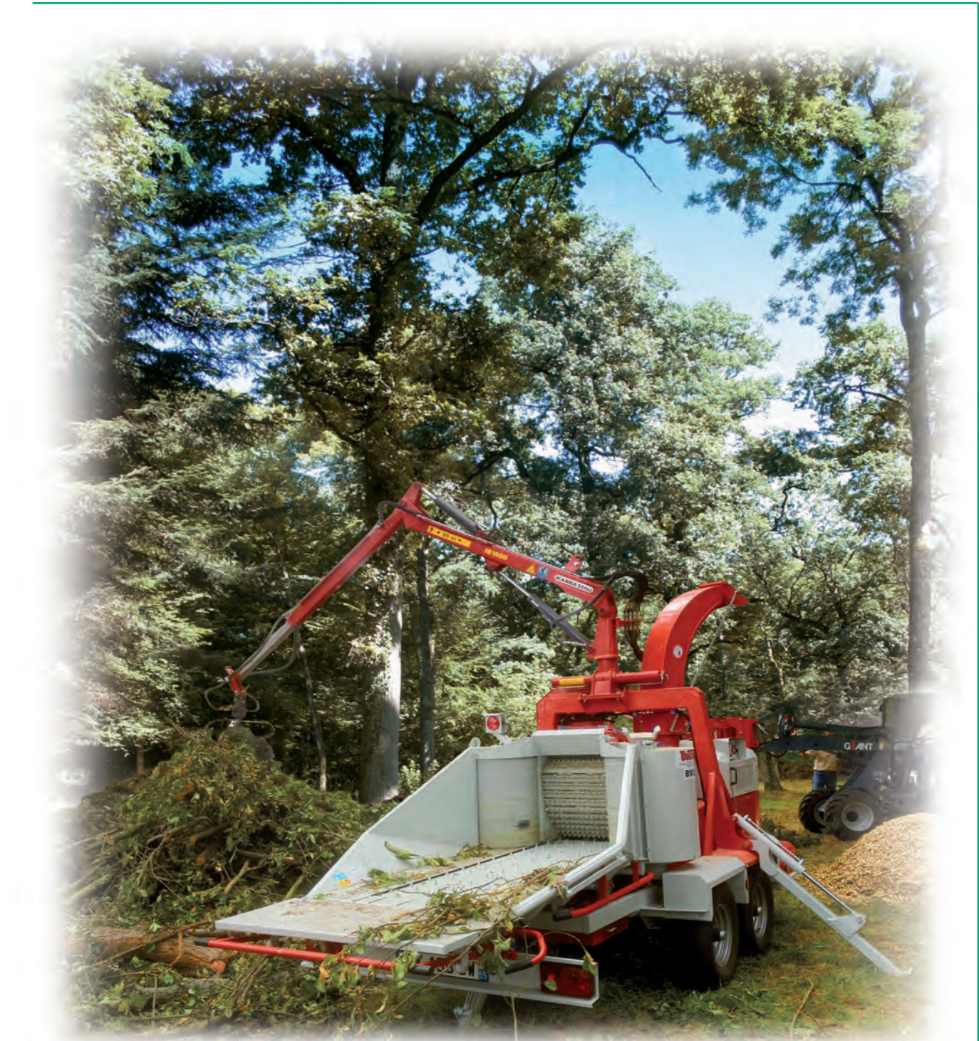
BV E11 G100 DE : Version diesel 100 CV, avec grue

BV N34 - BV N45 - BV E55 - BV N56 - BV E7 - BV E8 - BV E10 - BV E11 UNE GAMME COMPLÈTE POUR LES PROFESSIONNELS DES ESPACES VERTS