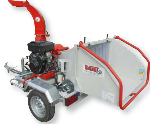
BV N45 18 RH : Version essence 18 CV avec rouleau ameneur hydraulique