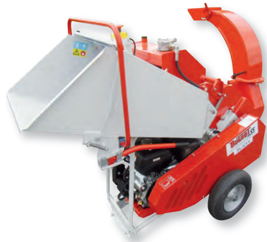
BV N34 14 AHS : Version essence 14 CV avec rouleau ameneur hydraulique, déplacement manuel