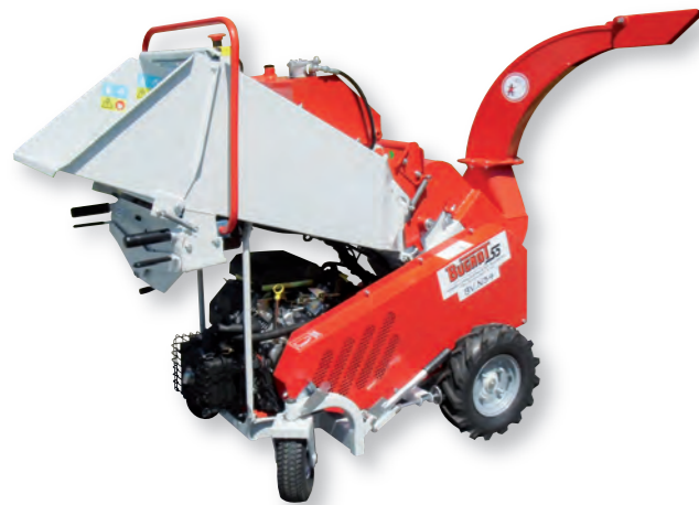
BV N34 18 DHS : Version essence 18 CV avec rouleau ameneur hydraulique. Châssis porteur auto-tracté