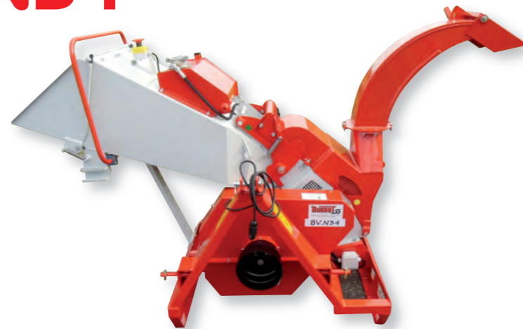
BV N34 PHS : Version prise de force 540 tr/mn avec rouleau ameneur hydraulique