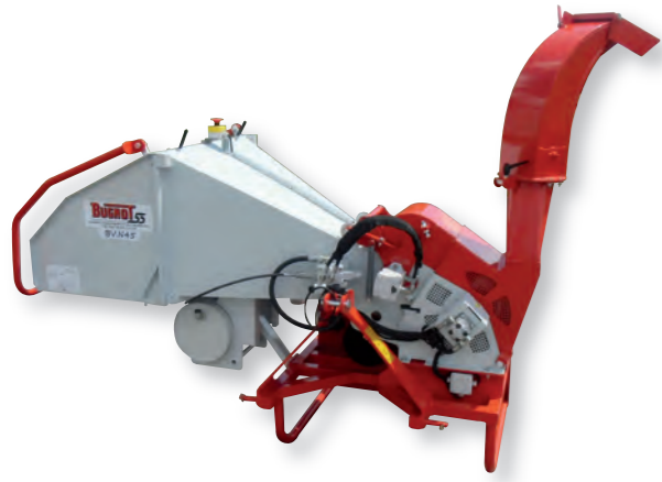
BV N45 PFH : Version prise de force 540 tr/mn avec rouleau ameneur hydraulique