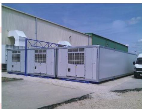
Assemblage des unités