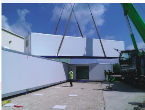
Pose des autres modules