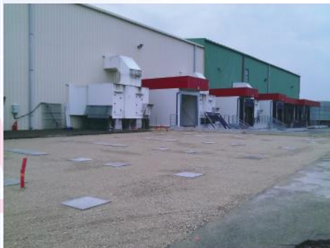
Préparation du sol