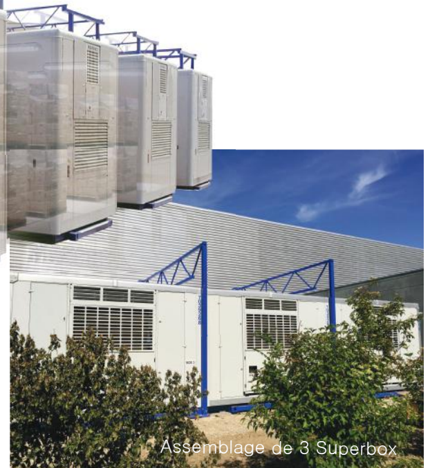
Assemblage de 3 Superbox