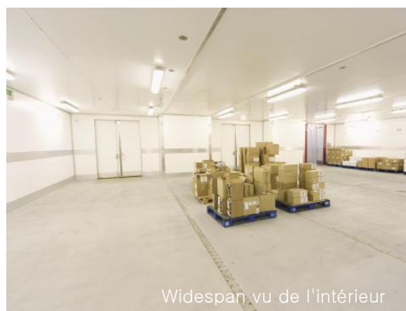
Widespan vu de l'intérieur