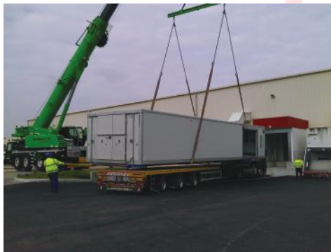
Premier module posé à l'aide d'une grue