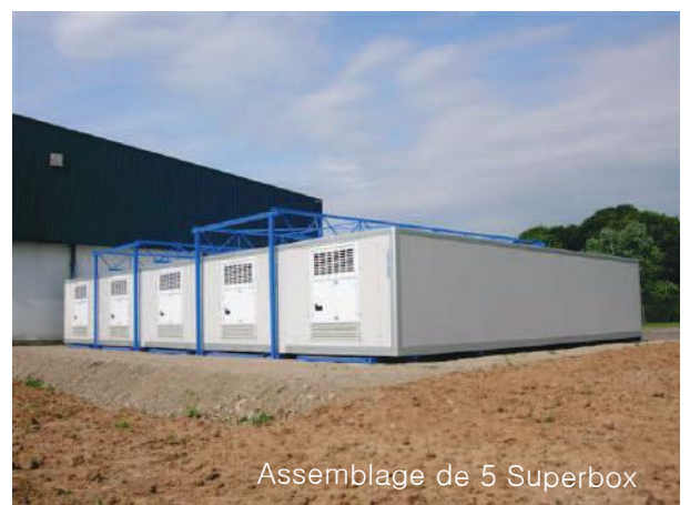
Assemblage de 5 Superbox

Simple ou double système de réfrigération par module