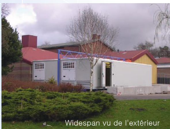
Widespan vu de l'extérieur