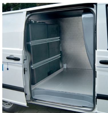
2 x 300 l réservoir eau propre