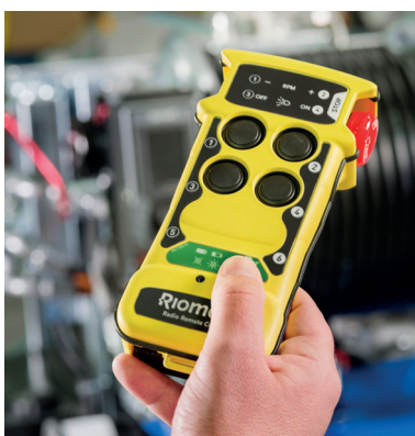
Radiocommande 5 voies RioMote