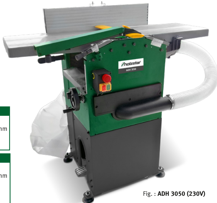
Fig. : ADH 3050 (230V)