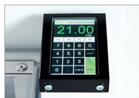
Commande électronique programmable avec écran tactile