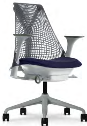
Piètement Gris clair Structure Blanche