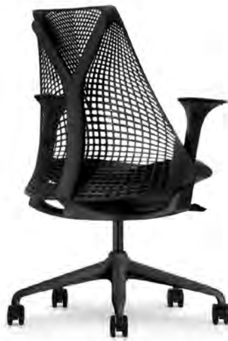
Piètement Noir Structure Noir