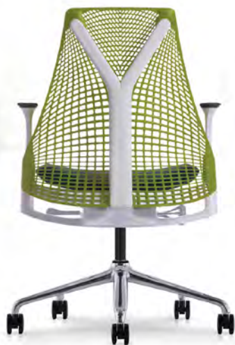
Piètement Chromé Structure Blanche