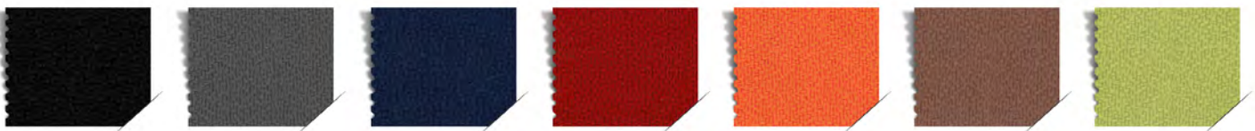
NOIR - 70009