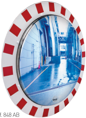
Réf. 848 AB