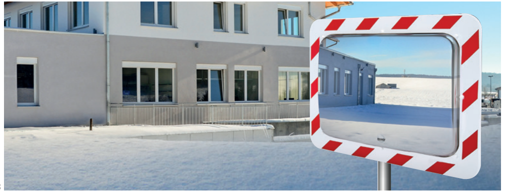
Réf. 858 AB