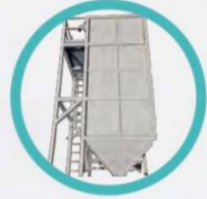
TDL 30 ou 60