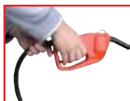
Pistolet avec pompe intégrée