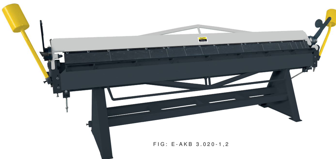
FIG: E-AKB 3.020-1,2