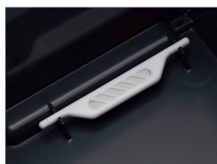
Stick Ionic Silver pour une eau d'évaporation parfaitement saine.