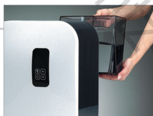
Réservoir d'eau amovible d'une capacité de 7 litres.