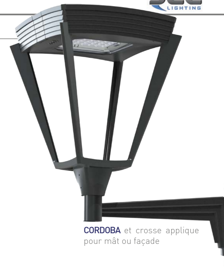
CORDOBA et crose applique pour mât ou façade