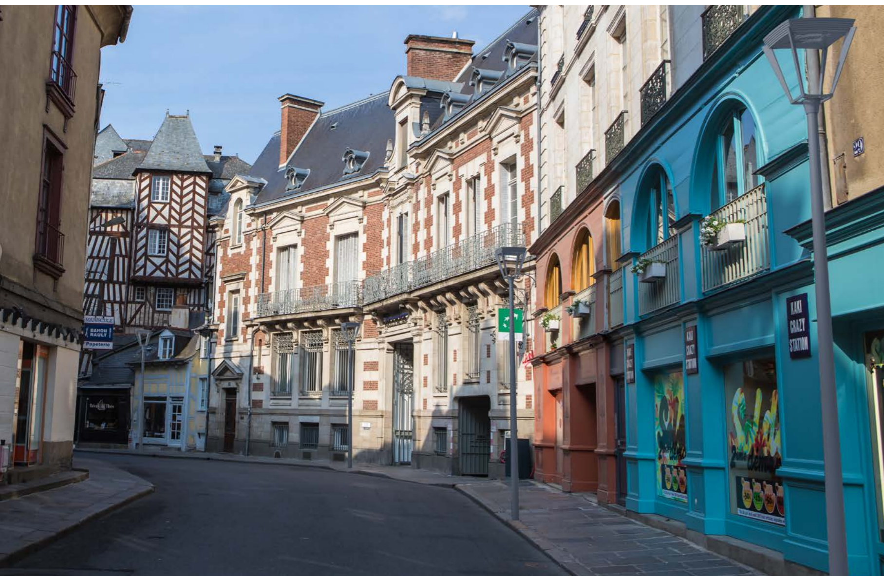
CORDOBA et optique confort PLUS pour les centres piétons