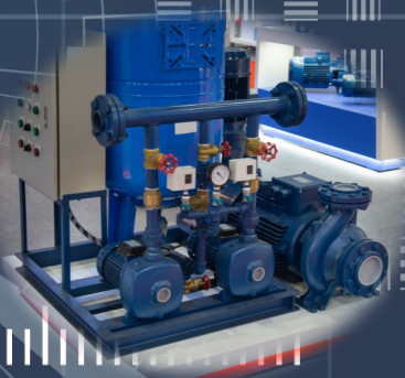
Traitement des eaux