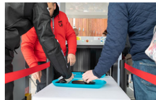
Bonne acceptabilité du public