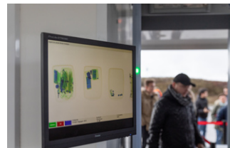
Scanner bagages Rayon X