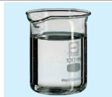
Après : Eau de chauffage telle qu'elle devrait être