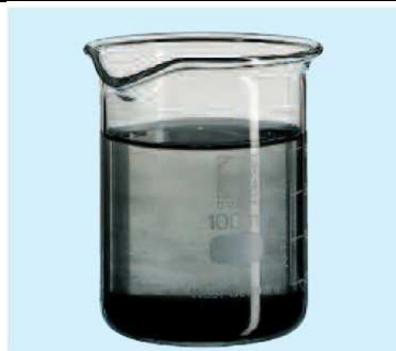
Avant : Eau de chauffage souillée par des particules de corrosion et de boue