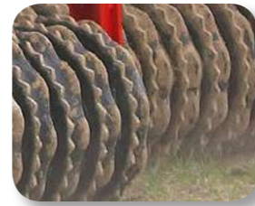
Disques en fonte