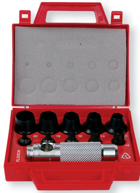
Coffret F 158 découpage joints